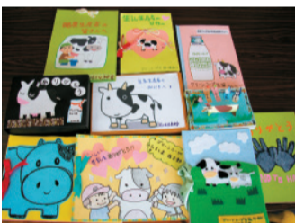
各単協の組合員から思いを込めて届けたメッセージの一部

「産直びん牛乳をずっと飲み続けていけるように」という思いを込めて届けたメッセージの一部