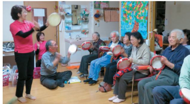
年に数回蓮華を訪れる「NPO法人 かごしまミュージックヘルパー協会」による療法的音楽活動。一緒に昭和の歌を歌ったり、リズム体操などで利用者を楽しませている