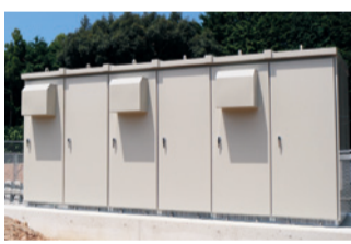
直流を交流に変え、電圧を上げて電線へ送るための装置が入っている

9月中旬からはじまる秋の組合員のつどいを前に、7月から各単協で活動している組合員による神在太陽光発電所の視察が行われています。視察では「なぜ糸島市につくったのか?」「パネルの