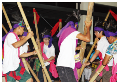
オルター・トレード社の記念式典の夜には、ステージでダンスを披露。みんなの真剣な姿に会場は拍手の嵐!