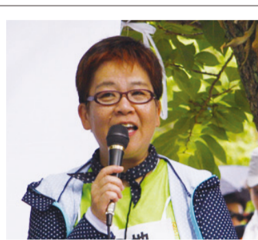
平和のつどいあいさつ