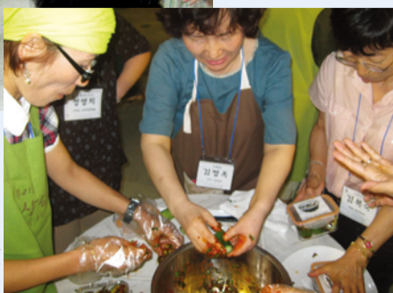
ハンサリム生協の組合員に教えてもらいキムチを手作り