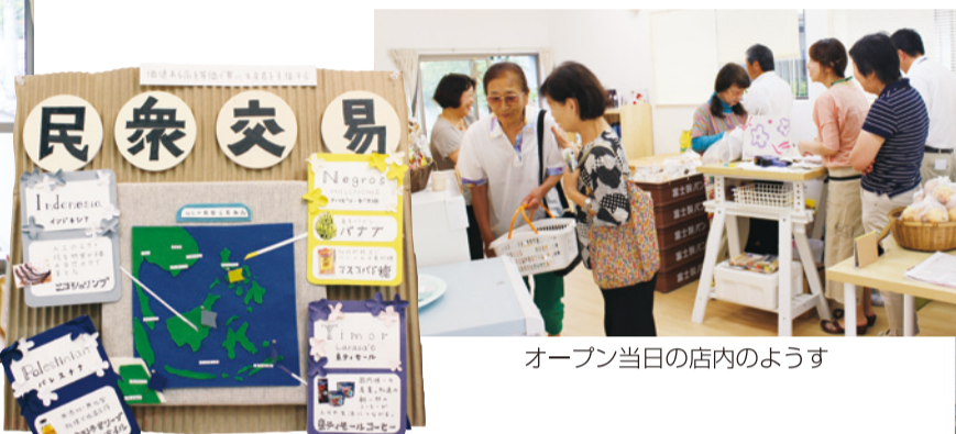
オープン当日の店内の様子