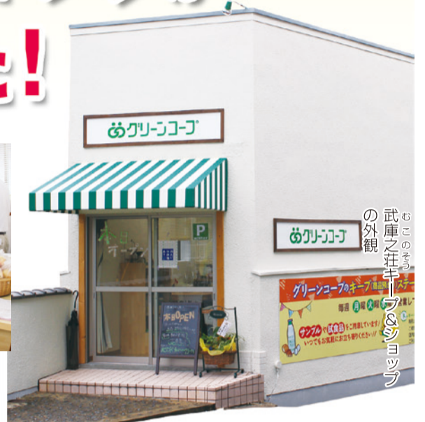
武庫之荘キープ&ショップの外観

民衆交易を分かりやすく説明している立体的なポップ。地図はフェルトで作っている。プロジェクトメンバーの手作り