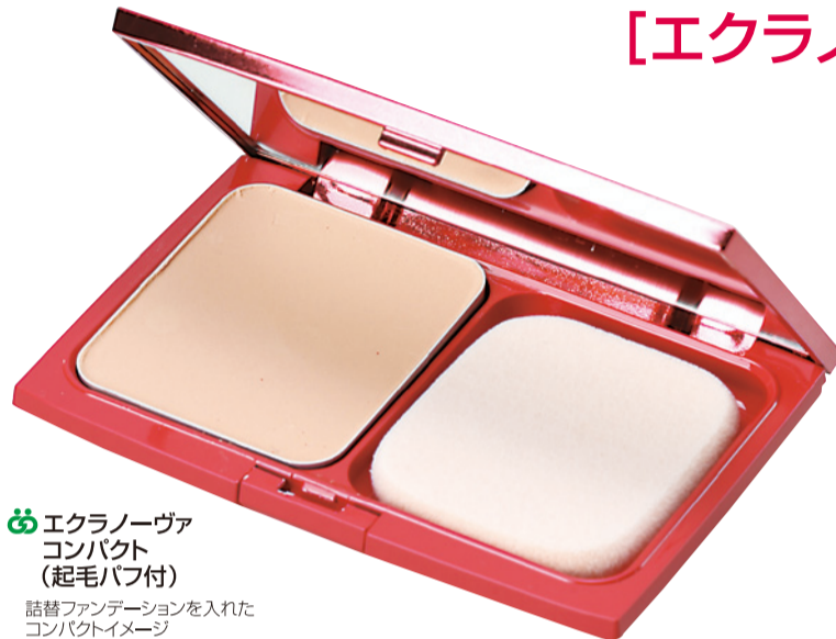
⑥ エクラーノヴァコンパクト (起毛パフ付)