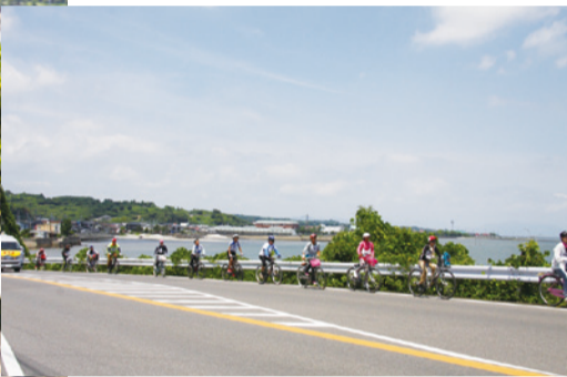
有明海沿いの坂道を走ります