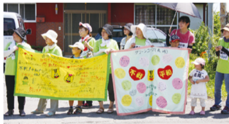
心のこもった手づくりの横断幕で声援