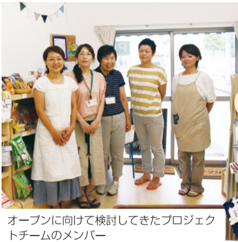
オープンに向けて検討してきたプロジェクトチームのメンバー