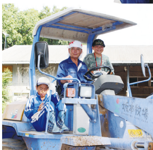
大型のトラクターに乗って牛舎の掃除に向かいます。大量のフンを一気に押し出します