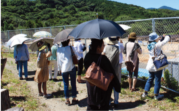
グリーン・市民電力担当者に質問しながら視察する単協の組合員

グリーンコープは「原発と生命は共存できない」という方針のもと、脱原発社会をめざす取り組みをすすめてきました。しかし、2011年3月に、東京電力福島第一原発事故が起きました。この未曾有の事故を受けて、グリーンコープでは組合員の思いと力を結集して、「一般社団法人グリーン・市民電力」を設立し、自然エネルギーに