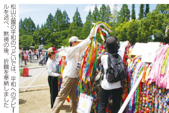
松山公園の平和のつどいでは、平和へのアピールを述べ、黙祷の後、折旗を奉納しました

今年韓国の方が25人も参加して頂いて、この平和を考える取り組みにとって貴重なことです。今後も引き継がれていくことは、とても意義あることだと思います。そして、私たちはこの2日間、本当に自分たちに大切なこと、平和が大切なこと、日常が大切なこと、人と人のつながりが大切なことを学びました。この経験を日々の生活に生かしながら、来年まで、自分を守ってくれる家族、友だち、いろんな人を大切に日常を生きていきたいと思えます。そうすることで、きっと日常の中で築かれる平和な世の中をずっと子どもたちに手渡していけると思えます。