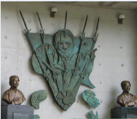
「ナヌムの家」・日本軍「慰安婦」歴史館の少女のレリーフ