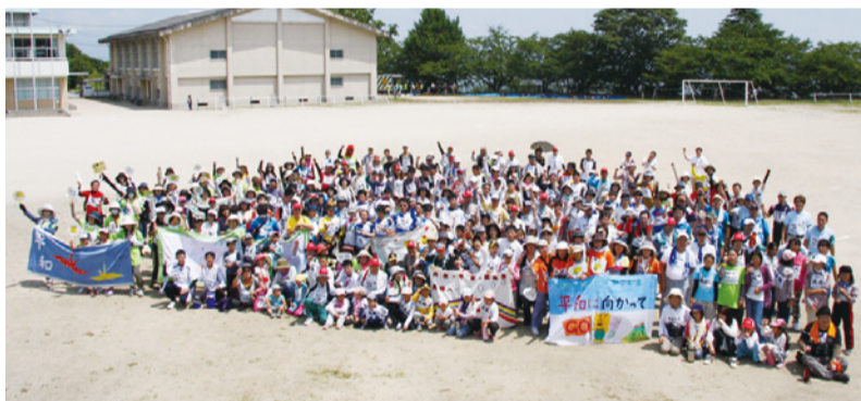
昼食休憩した鹿島市立七浦小学校で記念写真。「頑張るぞ、オー！」