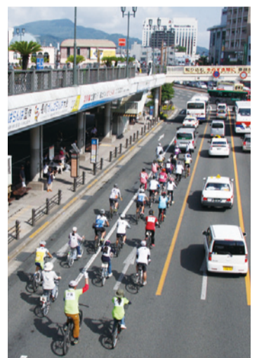
銀輪隊、自転車隊が隊列を組んで松山公園に向かいます