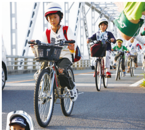
早朝の日差しにもめげずに大川橋を渡る子どもたち