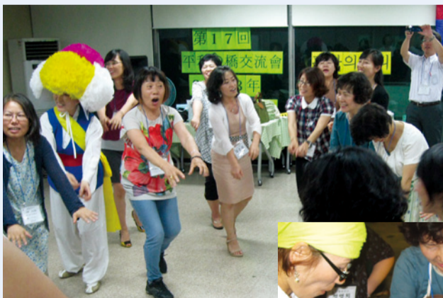
ハンサリム生協での交流会。最後はみんなで輪になって踊った