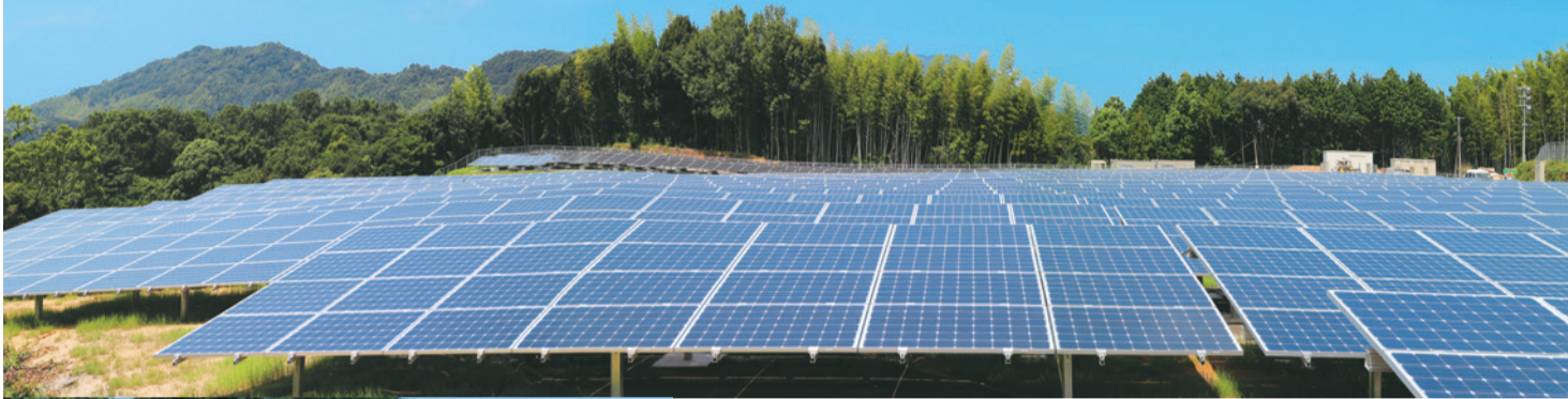
発電開始を待つ、4228枚のソーラーパネルが敷き詰められた神在太陽光発電所