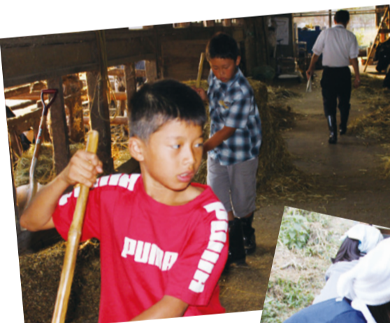
酪農家は早朝から大忙し。5時前に起床し8時すぎまで牛舎の掃除、えさやり、搾乳など朝の仕事が続きま

人が感想と生産者へのお礼を述べ、1人が修了証を受け取りました。生産者からは「これからも産直びん牛乳の応援団になつてください」「ホームステイで体験したことや分かったことを、周りの人に伝えてほしい」などの話がありました。参加した子どもたちは産直びん牛乳が自分たちのところ