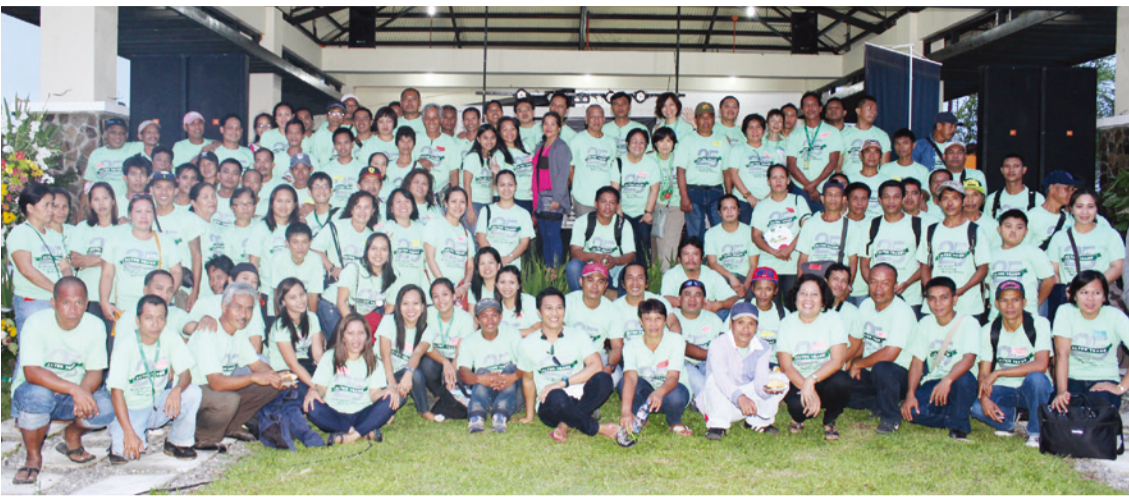
オルター・トレード社設立25周年記念式典パートナーズフォーラム 2013年7月27日 フィリピン ネグロス島 バコロド市

これまでの民衆交易の歴史を振り返るとともに、フォーラムと17回目になる青少年ネグロス体験ツアーのようすを紹介する。