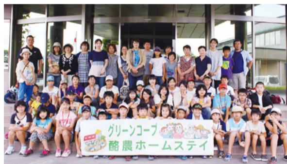
解散式の後、みんなで記念撮影

1日目、JA菊池農業総合情報センター「パシオン」に集まった子どもたちは、これから始まる酪農ホームステイについて説明を受けた後、お世話になる生産者と対面。少し緊張した面持ちでそれぞれの滞在先に向かいました。 翌日、子どもたちは早朝から牛舎の掃除、えさやり、搾乳、タオル洗いや、基本的な作業を体験しました。少しずつ牛に馴れ、いろいろなことに積極的にチャレンジして、すっかり酪農家の一員です。牛は出産しないとお乳を出しません。その大切なお乳の温かさ