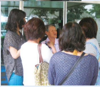
具合が悪いにもかかわらず、ハルモニが玄関で迎えてくれた