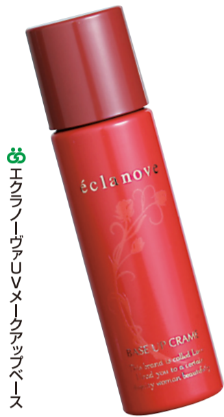
⑤ エクラーノヴァUVメイクアップベース

40代・50代の肌の悩みを解決したいと、ふくおかが2年間で開発した化粧下地とファンデーション「エクラーノヴァ」が7月に新登場しました。メイクアップした肌の仕上がりが明るくなったなど若い世代からも好評です。