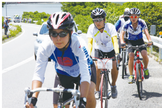
今年初めての韓国ウリマウルクムトからの参加者たち。気分が入っています

8月8日早朝、銀輪隊81人と自転車隊92人が被爆地長崎をめざして自転車隊で柳川を出発しました。組合員やスタッフ、沿道からの声援を受けながら、「不戦」のゼッケンを背に、猛暑の中125kmをひたすら自転車をこぎ、8月9日の朝、長崎に着きました。 「平和のつどい」では、銀輪隊に参加した韓国ウリマウルクムト代表の子どもたちも一緒に「平和へのアピール」をし、平和への願いをこめて一つにしました。 ※麻浦、トコ生協の、組合員たちと村の子どものための附設教育機関