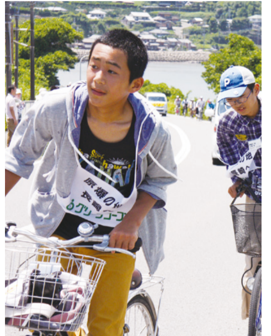
アップダウンを繰り返す道が続く。長い坂