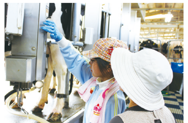
牛に搾乳機を取り付けて搾乳にも初挑戦