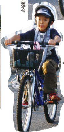
暑いけど、頑張るぞ！