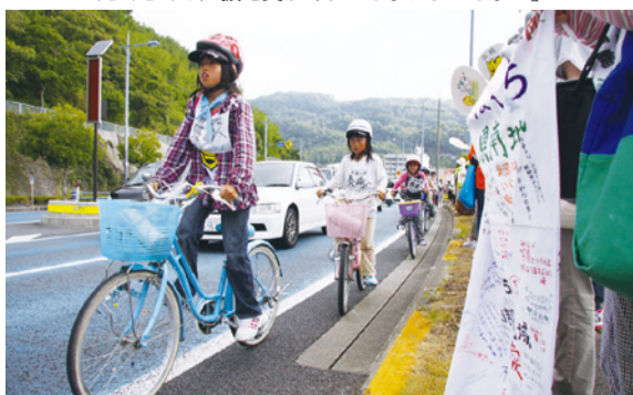
たくさんの声援を受け「よいしょ、よいしょ！」