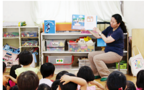
保育園でのよみきかせの様子