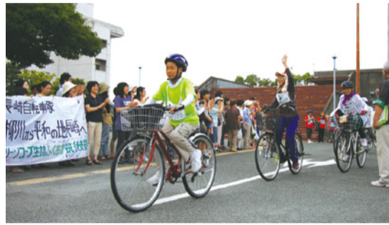
早朝6時、柳川を出発。たくさんの声援を受けて、元気に「行ってきます！」