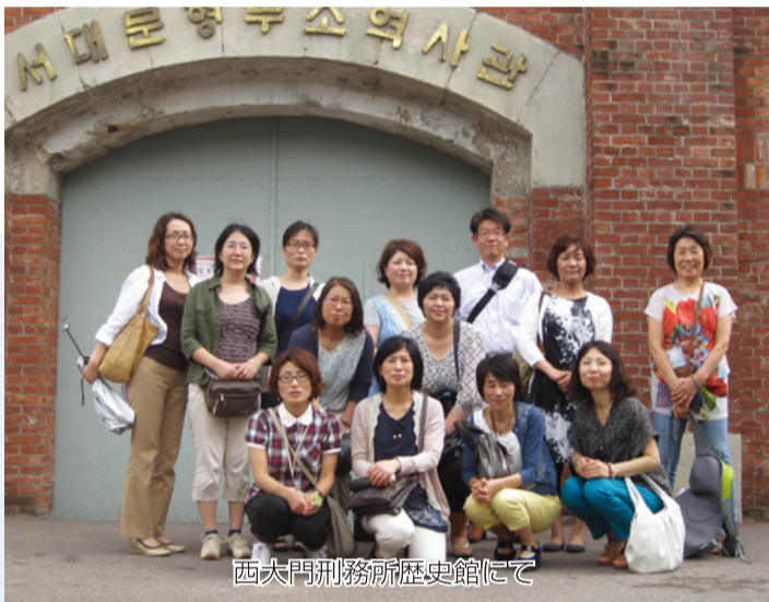
西大門刑務所歴史館にて