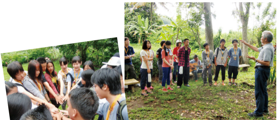
円陣を組み、手を重ねあわせる。行事ごと一日に何度も

まだだったり、とても古い家があったりと、日本とまったく違う景色だったことです。でも、ネグロスの人たちがみんな良い人達で、到着してしばらくすると、仕様もないこととずつと心配していた自分がアホらしくなってきました。3日目の夜、イベントのステージでダンスを表現した頃からみんなといるのが「楽しい」と思うようになりました。ハエが飛び交う環境の違いにも大分慣れて、終盤にはハエを素手でつかまえることも、それなりに上手にできるようになりました。瞬間に数日が過ぎました。実に楽しかったです。学ぶべき事が多いこのツアーに参加できて良かったと思います。