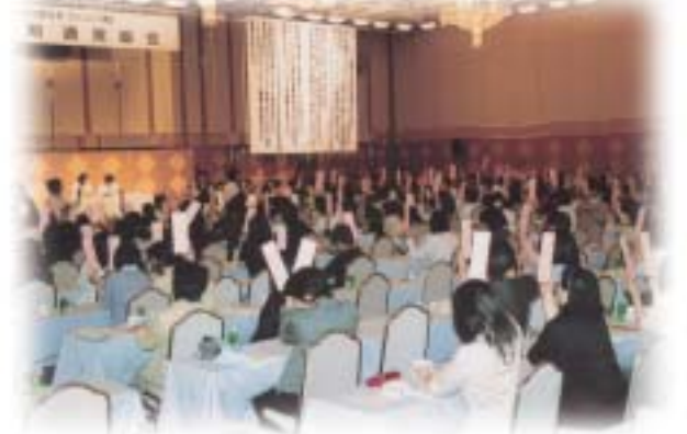
採決票を挙げる代議員