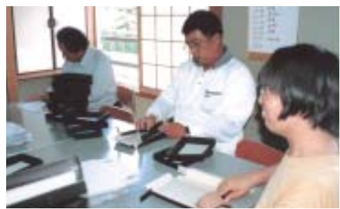
話をしたり笑いながらも、慣れた手つきで箱折りに集中する