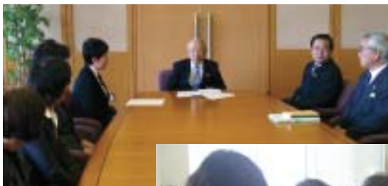
▲県議会(議長)へ請願書提出