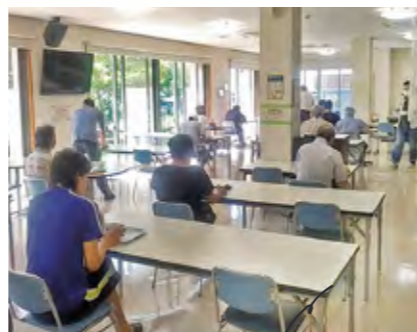
明るく開放的な食堂。コミュニティスペースとしても使われています。