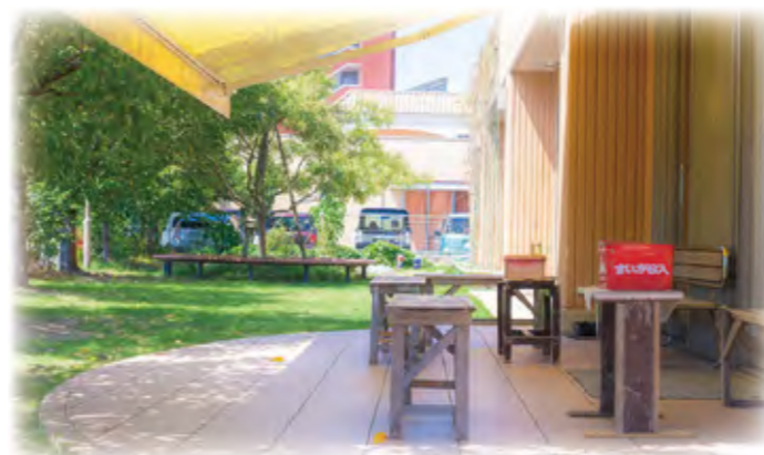
1階、食堂の外の庭スペースに喫煙所を兼ねたベンチがあり、入居者が和やかに談笑されていました。

厳しい社会状況の中、職や住まいを失い経済的な困窮に陥ることで、人とのつながりや地域との関係までも断ち切れ、孤立する人が増え続けています。抱樸館はそのような方々を支援し、共に生きる地域社会を創るために入居者の自立に向けて伴走しています。