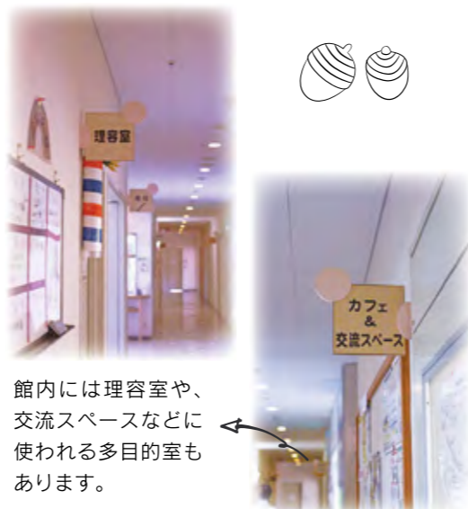
館内には理容室や、交流スペースなどに使われる多目的室もあります。

2階の洗濯室には、洗濯機と乾燥機が数台ずつ。その奥、日当たりのよいテラスに洗濯物が干されていました。緑豊かな川辺が眺められ、心地よく開放的なスペースになっています。