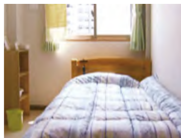
入居者のプライベートスペース。清潔で明るい居室です。