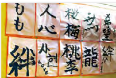
お正月の書き初め。館内のあちこちに、たくさんの方の掲示物が展示されています。