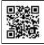
グリーンコープ生協ふくおか リユース・リサイクル動画

グリーンコープは、びん容器をできるだけリユースびんにして、自主回収、再使用しています。くり返し使うことで資源をムダにせず、ゴミを減らすことができます。グリーンコープ商品を利用し、まずは返すことから始めましょう！