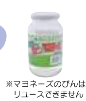
※マヨネーズのびんはリユースできません