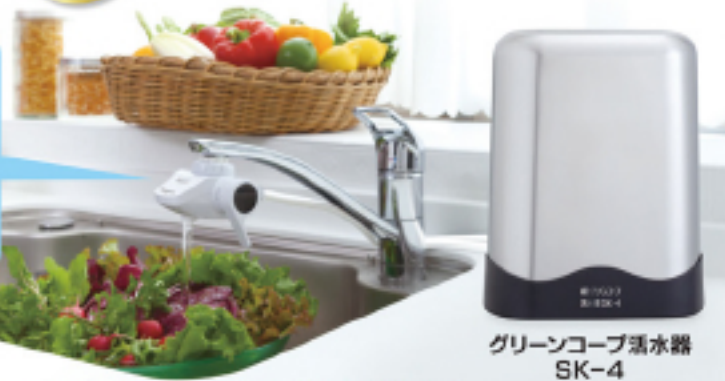
グリーンコープ活水器 SK-4