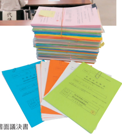
各生協から届けられた書面議決書

2020年7月3日、一般社団法人グリーンコープ共同体第三期定時社員総会が開催されました。 当初、社員総会は6月10日に開催を予定していましたが、新型コロナウイルスの収束の目途がたない中、組合員、ワーカー、職員が一堂に会す形での総会の開催は難しいと考え、7月に延期しました。実出席を少なくし、書面議決書を中心とした総会となりました。総会当日は、全ての議案が賛成多数で可決承認されました。ワーカーズ型生協とワーカーズ型社会福祉法人として大いに飛躍し、地域と共に生きるグリーンコープへと邁進することを確認しました。