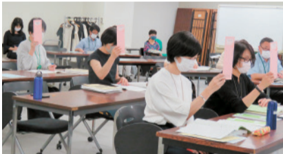
採決票を挙げる実出席者