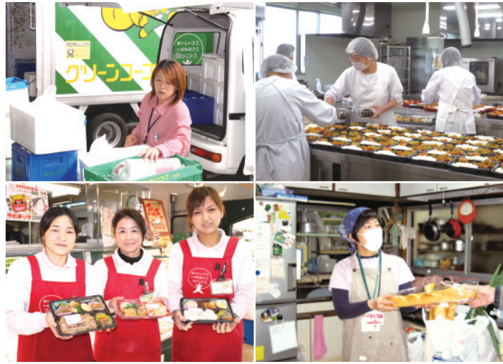
組合員がワーカーズとして、グリーンコープの様々な業務の担い手となっています