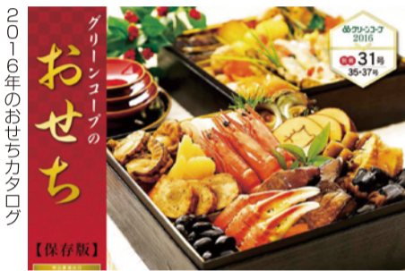
2016年のおせちカタログ